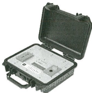
Рисунок А.1. Внешний вид измерителя параметров разрядников и выравнивателей ПРВ-01

Измерители параметров разрядников и выравнивателей ПРВ-01 предназначены для измерения параметров разрядников и выравнивателей, устанавливаемых в устройствах защиты: напряжений пробоя разрядников, классификационного напряжения, силы тока утечки и вычисления коэффициента нелинейности выравнивателей.