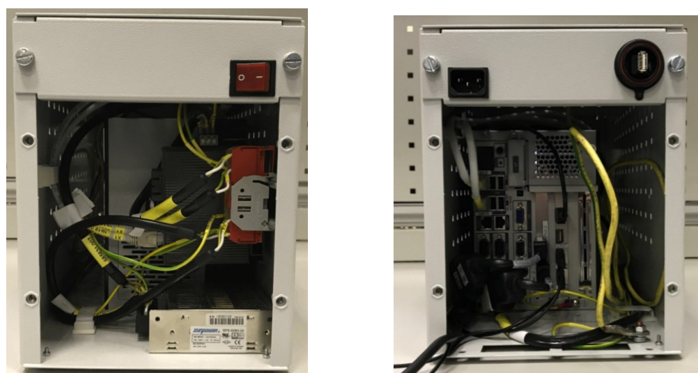
Рисунок 3. Вид системного блока со снятыми крышками.

7.1.4 Отвернуть по четыре винта на лицевой и задней панели крестовой отверткой и снять переднюю и заднюю крышки системного блока (Рисунок 3).