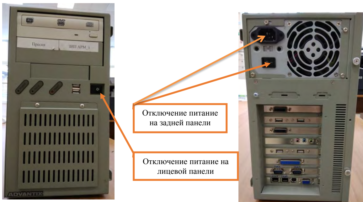
Рисунок 2. Отключение питания системного блока.

7.1.2. Отключить электропитание на передней и задней панели системного блока (Рисунок 1), извлечь вилку кабеля питания из розетки «220 В» и розетку кабеля питания из системного блока (Рисунок 1). Отсоединить кабели клавиатуры, манипулятора типа «мышь», монитора и принтера от системного блока.